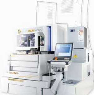
数控线切割放电加工机床