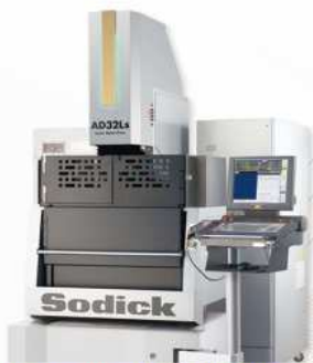
数控电火花放电加工机床