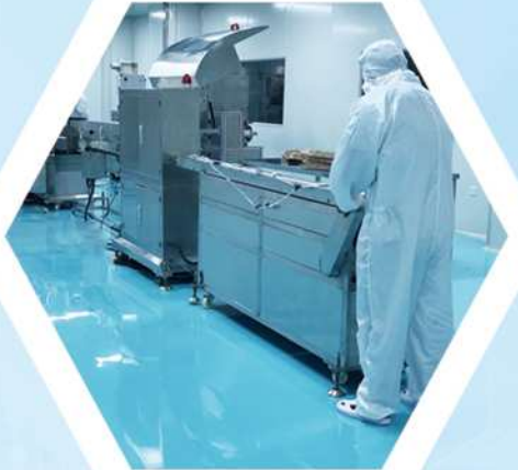
十万级洁净车间 百级净化区