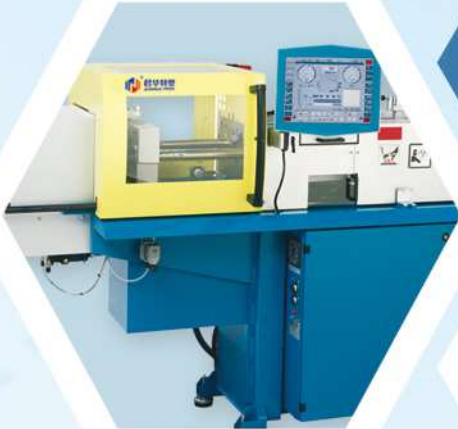
德国进口 微型精密注塑机