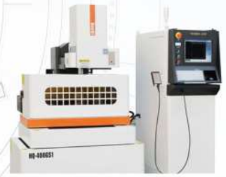
伺服中走丝切割机床